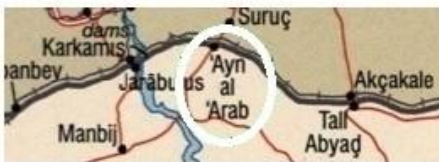
Publié par la Bibliothèque de Congrès en Washington - 2007

Regardez ces deux images d'une partie de la carte de Syrie.