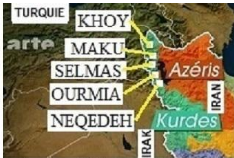
La Province 90% Azerbaïdjanais (en Iran) prétendue comme celle des Kurdes par les Médias Français

Les médias français prétendent une partie de l'Azerbaïdjan (en Iran) comme la terre des kurdes. C'est faux, ces villes et leurs villages frontaliers avec la Turquie ( Khoy, Maku, Salmas, Ourmia et Negedeh ), toujours étaient 90% peuplés d'azerbaïdjanais et 10% kurdes qui y vivent, sont des réfugiés kurdes irakiens de l'époque de Saddam qui sont installés par le régime iranien pour changer la démographie de la région. Dans ces villes aucun maire kurde comme toujours.