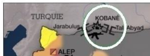
Publié par France 24 13/10/2014

La première a été publiée par la Bibliothèque du Congrès de Washington en 2007. La ville du nord de la Syrie en frontière avec la Turquie s'appelle (Eyn Al Arab), et non pas (Kobané). La deuxième image se publie dans les médias français au faux nom de (Kobané), et non pas (Eyn Al Arab).