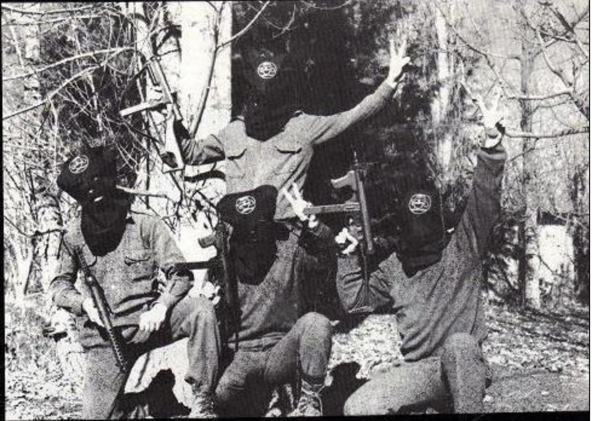
Les Terroristes Arméniennes